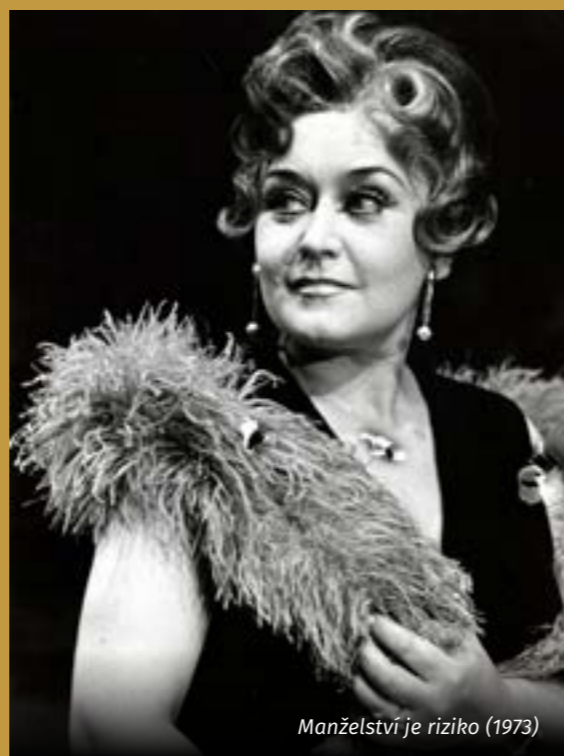
Manželství je riziko (1973)