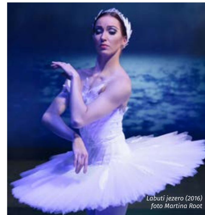
Labutí jezero (2016)