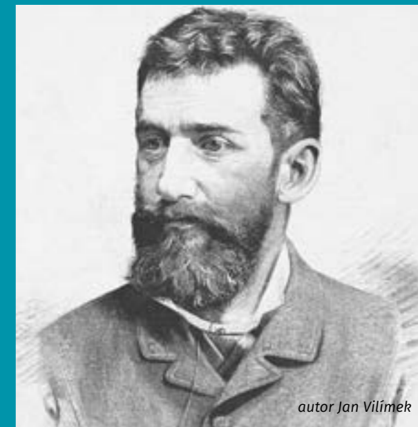
autor Jan Vilímek