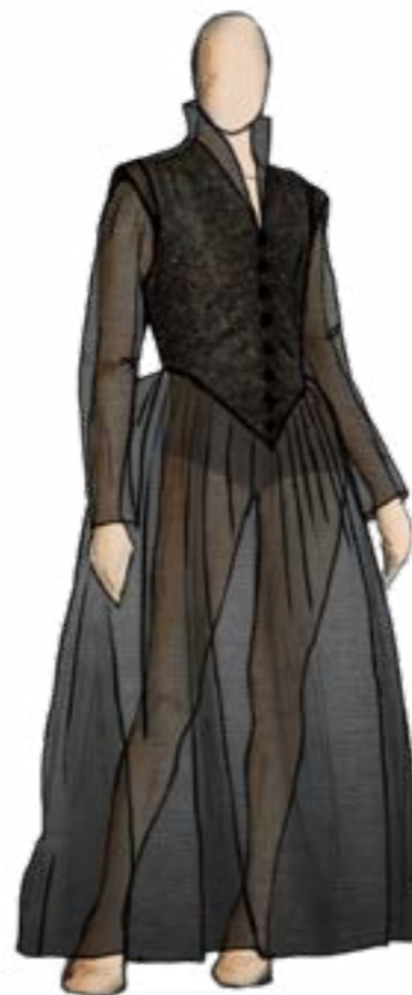
kostýmní návrh Louise Flanagan

V obou příbězích nacházím řadu podobností. Asi nejzásadnější z nich je zakázaná láska milenců, nicméně ta nebyla hlavním důvodem k výběru tohoto námětu. Více než téma lásky mě zajímá postavení arcivévodky Ferdinanda coby druhorozeného syna krále a jeho povinnosti vůči koruně. Evidentně není možné se vyhnout očekáváním královské rodiny,