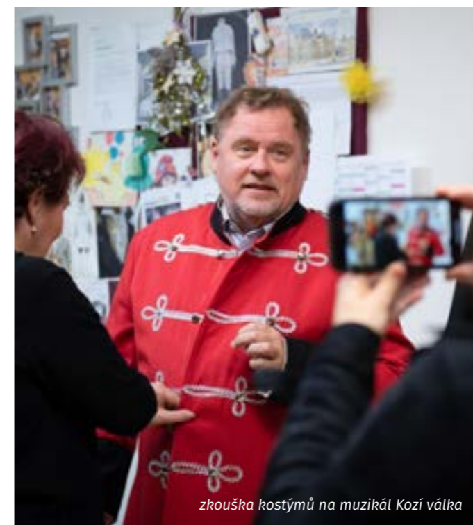
zkouška kostýmů na muzikál Kozí válka