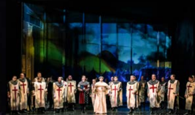
scéna z opery