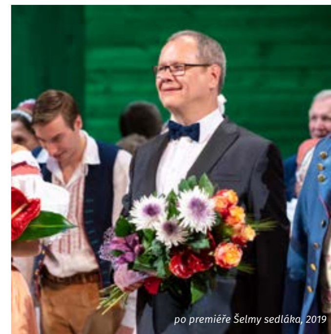
po premiéře Šelmy sedláka, 2019

Armida je vrcholné Dvořákovy operní dílo, byť není tak populární jako třeba Jakobín , Čert a Káča nebo Rusalka . Trpí poměrnou rozvleklostí, ale té se dá vhodnými škrty a režii pomoci. V Plzni zazněla naposledy před osmdesáti lety, takže ji většina našich diváků nemůže pamatovat.