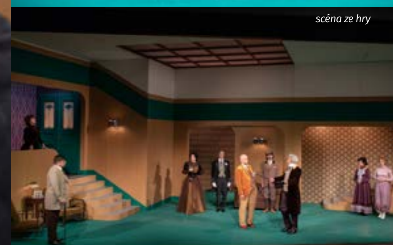
scéna ze hry