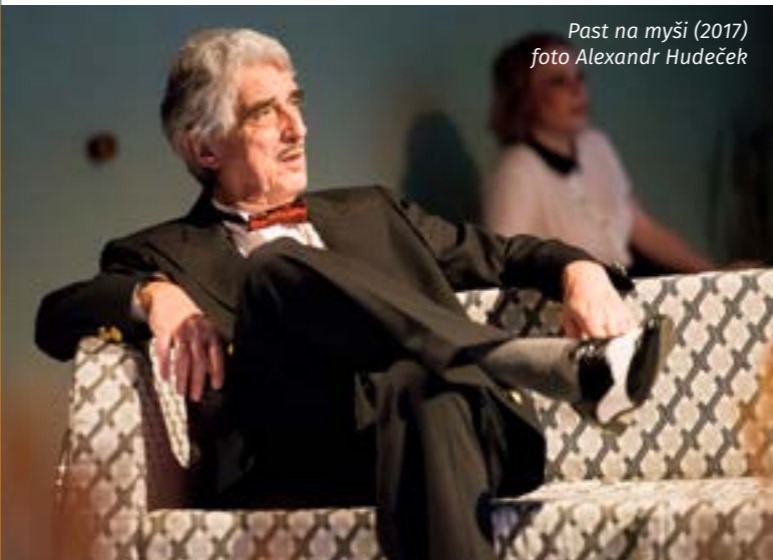
Past na myši (2017)