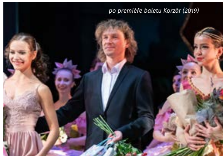
po premiéře baletu Korzár (2019)

Nevím, zda se tomu říká probuzení, když začnete v dětství okamžitě tančit, když slyšíte hudbu, a představujete si hned prolínající živý příběh, právě v kontextu hudby. Největší inspirací mi ovšem stále zůstává hudba a vnitřní instinkt. V poslední době nejraději vzpomínám na in-