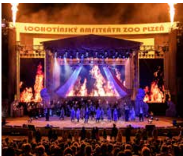
Noc s operou – Elisabeth (2022)