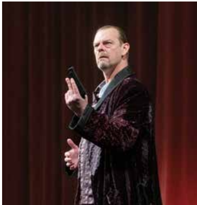
Být nebo nebýt (2024)

Jo, snažím se. Ale tím, jak už jsem starý pán, tak mi odchází