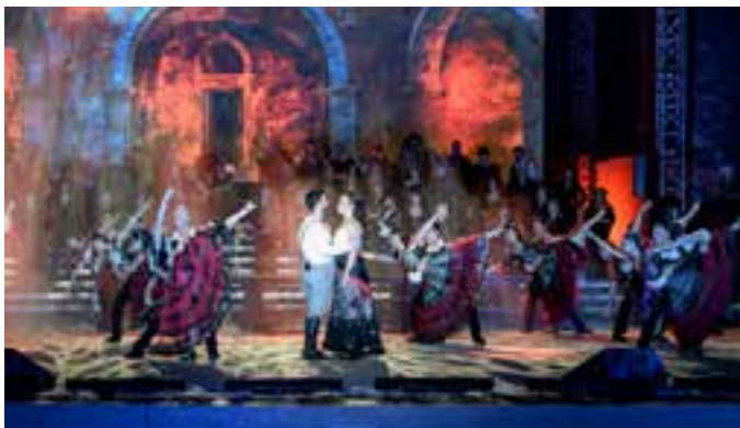
Noc s operou – Carmen (2023)