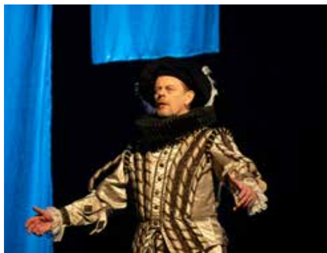
Být nebo nebýt (2024)

Nemám žádné ambice. Už jsem to často říkal: veškeré vysněné role jsem si zakázal. Můžeš si vysnit cokoliv, pak vyjde obsazení a všechno je úplně jinak. Lepší nechat to být a tím jsem se flegmaticky dostal k rolím, o kterých jsem si nikdy nemyslel, že bych je mohl hrát. Než být zklamanej, nech život běžet. Nechci ale vypadat jako úplnej salámista. Když už máš jméno a chceš nějak fungovat, neměl bys nikdy podlízt nějakou svou laťku. Proto když dostanu úkol, tak ho nechci zbabrat. Je tam závazek vůči tomu všemu, co už máš za sebou. A chci se nějakým způsobem posouvat dál. Na zkoušení v divadle mě baví, že režisér tě vezme a otevře ti ještě nějaký dveře, který jsi vůbec nevěděl, že máš. Tohle mě na mé práci baví. U divadla musí bejt pokora. Když ji nemáš, tak ti tak nafackuje, že se z toho posereš. S prominutím.