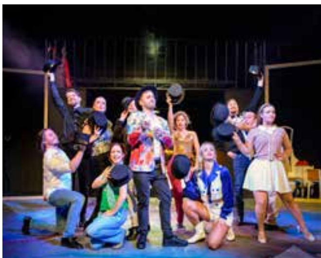
Účinkující muzikálu Company (Přátelé)